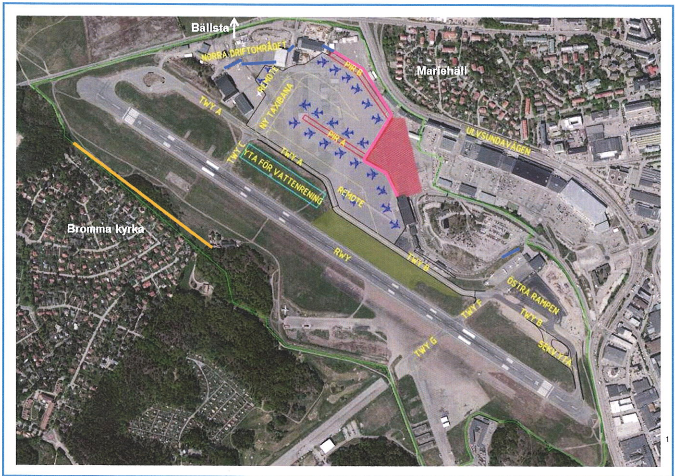
Figur 1. Planerade förändringar, inklusive ungefärlig placering av planerade markbullahavskärmningar (rosa, blå och orangea streck).

I arbetet med att ta fram en framtida utformning av flygplatsen har stort fokus lagts vid att hitta avskärmningsmöjligheter för markbuller och en ny förbättrad vattenhantering. Vad gäller markbuller visar genomförda beräkningar att förändrad utformning av flygplatsområdet, inklusive planerade avskärmningar mot Mariehäll/Annedal, Bromma Kyrka och Bällsta, kommer att leda till lägre eller oförändrade markbullernivåer jämfört med vid dagens flygplatsutformning. Föreslaget system för hantering av glykolbelastat dagvatten vid flygplatsen är baserat på ny teknik som bryter ner glykolen och därmed minskar utsläppen. Samtliga planerade förändringar ryms inom flygplatsens gällande miljövillkor. Förändringar i utformningen av flygplatsområdet har anmälts till Miljö- och hälsoskyddsnamnden i Stockholms stad.